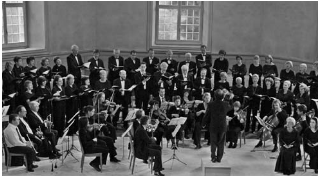
Kantatenchor und Bach-Collegium Bern