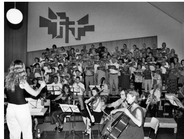
Chor und Orchester der Sommerakademie 2005 beim Abschlusskonzert in der Johanneskirche